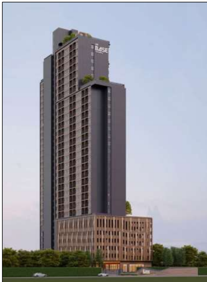
รูปที่ 2-3 ภาพจำลองโครงการ

การจัดภูมิสถาปัตยกรรมมีทั้งส่วนที่เป็นภูมิทัศน์แข็ง (Hardscape) และภูมิทัศน์นุ่ม (Softscape) โดยแนวคิดการจัดภูมิสถาปัตยกรรมในส่วนของ Hardscape ส่วนใหญ่เป็นการตกแต่งพื้นผิวของทางเดินบริเวณอาคาร ส่วนแนวคิดการจัดภูมิสถาปัตยกรรมในส่วนของ Softscape นั้นเน้นการตกแต่งโดยปลูกไม้ยืนต้นและไม้พุ่ม เพื่อเพิ่มความร่มรื่นของพื้นที่ ช่วยลดความกระด้างของโครงสร้างอาคาร ต้นไม้จะช่วยทอนสัดส่วนของอาคาร และลดผลกระทบต่อทัศนียภาพของผู้สัญจรไปมาได้อีกด้วย