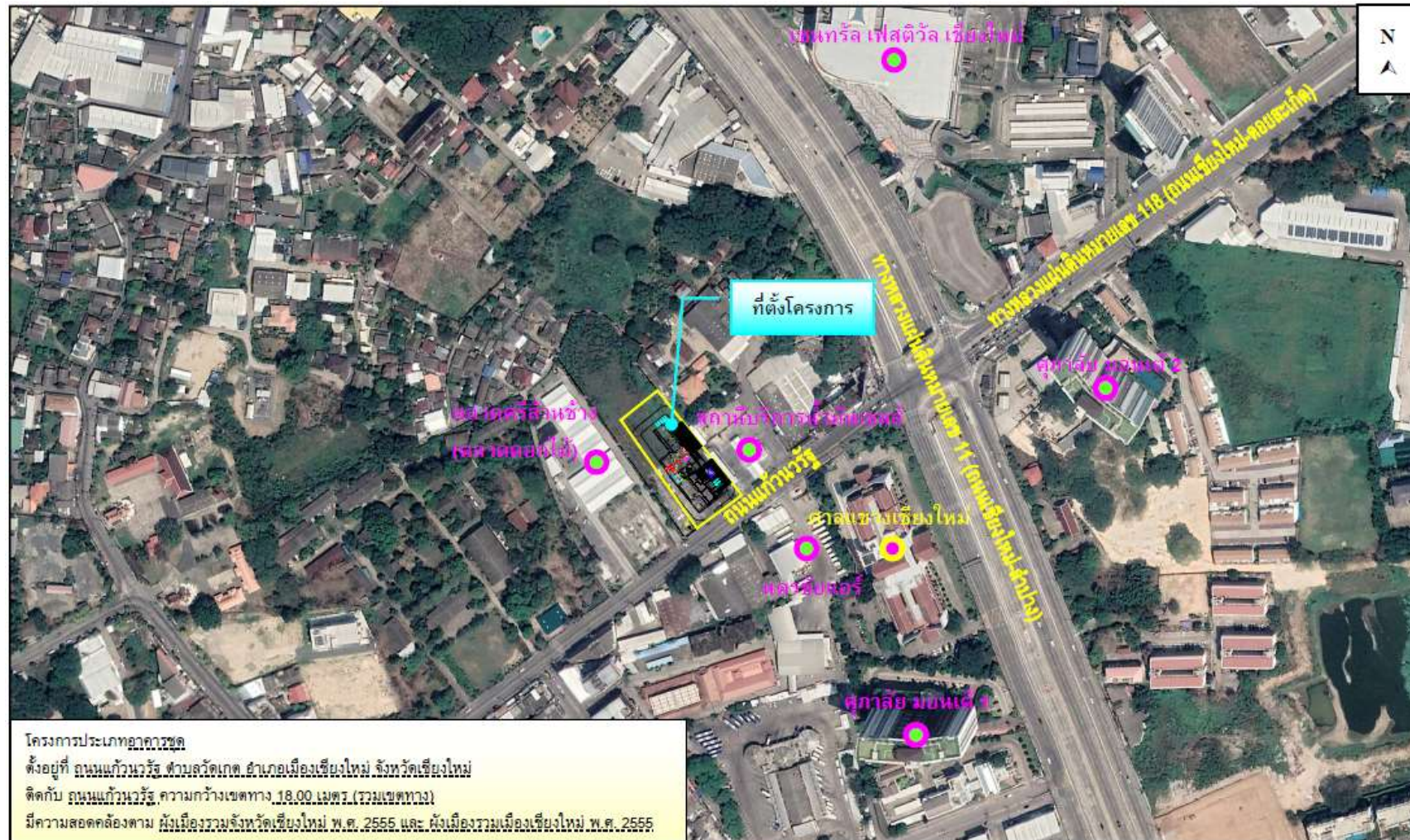
รูปที่ 2-1 ที่ตั้งโครงการ